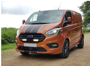
FORD TRANSIT CUSTOM 2018+