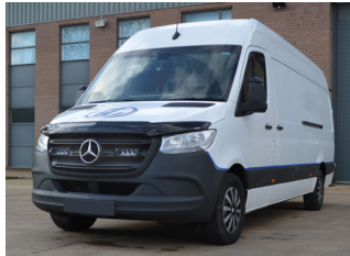
MERCEDES X-CLASS 2018+