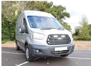
FORD TRANSIT 2017+