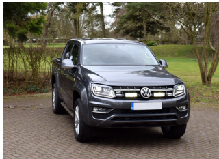
VW AMAROK V6 2016+