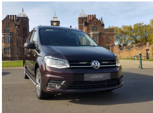
VW CADDY 2015+