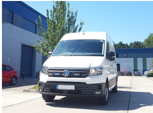
VW CRAFTER 2017+