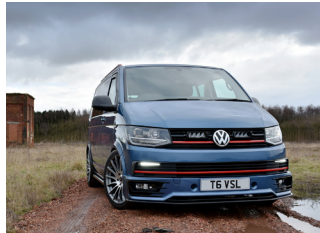
VW TRANSPORTER 6 2016+